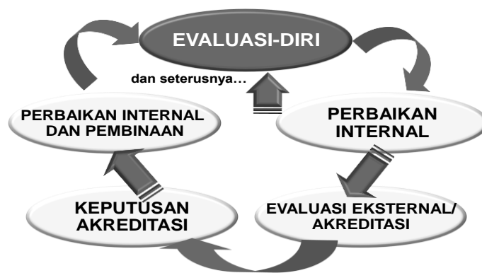
Gambar 1 Daur Penjaminan Mutu dalam Rangka Akreditasi

Seperti dikemukakan terdahulu, evaluasi-diri merupakan salah satu aspek penting dalam keseluruhan daur akreditasi dengan berbagai peran dan kegunaannya, termasuk penjaminan mutu ( quality assurance ). Keseluruhan daur penjaminan mutu dalam rangka akreditasi perguruan tinggi dapat dilihat pada gambar berikut.